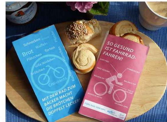
Die AGFK-Brötchentüten zum Thema Gesundheit und Umwelt

Gem. Anschaffung: Brötchentüten für Kampagne