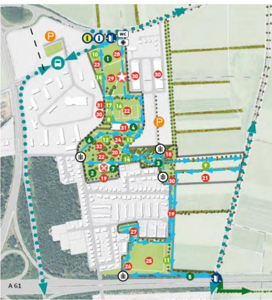
Der Kernbereich Kurfürstkasernen (12,5 Hektar) nördlich der Autobahn A 61 in Speyer-Nord