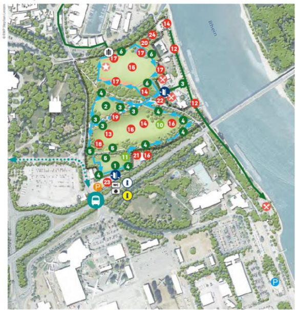
Das Kernareal Küpfelsau (7,5 Hektar) im historischen Zentrum hat bereits heute den Charakter eines Bürgergartens.