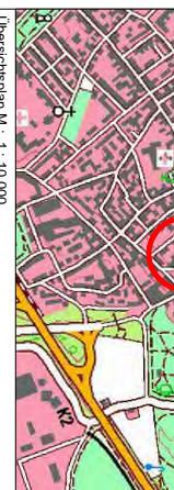
Übersichtsplan M.: 1 : 10 000

Das gesamte Gebiet liegt innerhalb der Grabungsschutzzone „Archäologisches Speyer – Vorgeschichte bis Neuzeit“ §22 DstG Rhinland-Pfalz