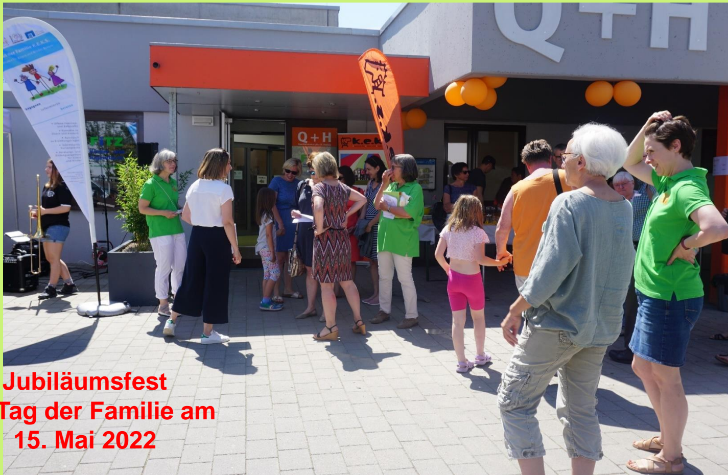
Jubiläumsfest am Tag der Familie am 15. Mai 2022