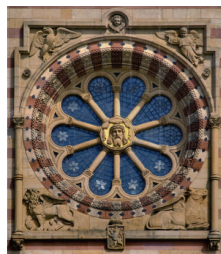
Fensterrose Dom Speyer