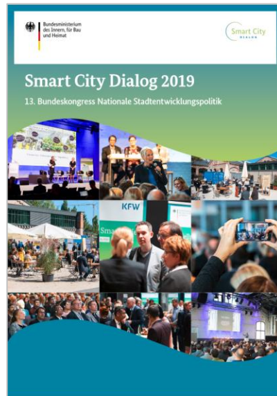
Vorstellung der Modellprojekte 2019