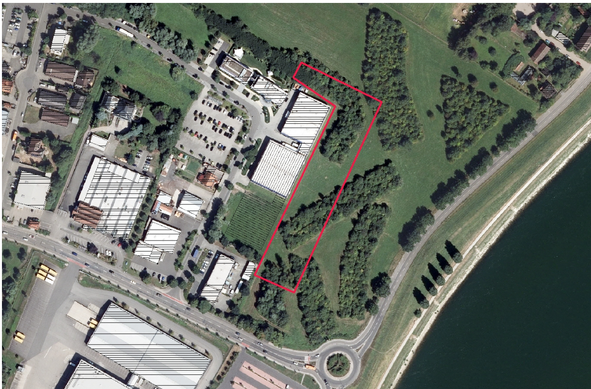
Abb. 2: Geltungsbereich der Änderung des Bebauungsplans „Schlangenwühl-Nord“

Der für die Bebauung vorgesehene Geltungsbereich grenzt direkt an die schon bestehenden Lagerhallen und Bürogebäude der PM International AG. Bei der Planfläche handelt es sich bislang um eine Grünfläche, auf welcher in den vergangenen Jahren Gehölzstrukturen angelegt wurden. Die Grünflächen werden derzeit mit Rindern und Ziegen beweidet. Im Norden, Osten und Süden grenzen weitere Grünflächen an, die ebenfalls junge Gehölzstrukturen aufweisen. Westlich an die Fläche grenzt gewerbliches Baugebiet. Die komplette Grünfläche wird im Süden von der Austraße und im Westen von der Franz-Kirrmeier-Straße eingefasst (siehe Abb. 2).