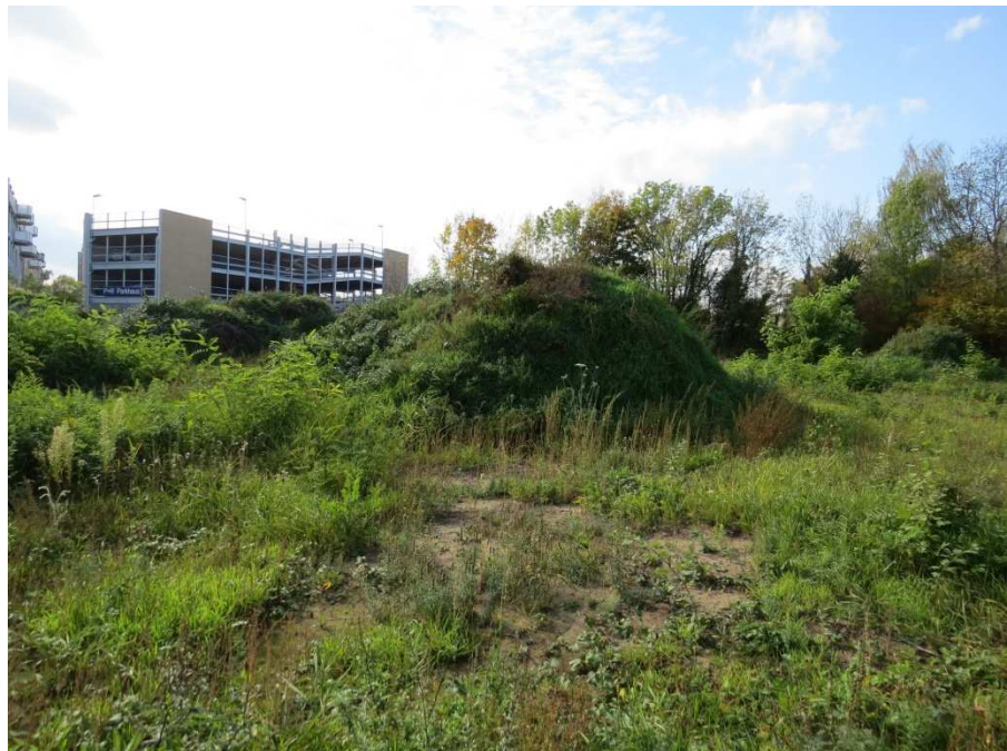
Abbildung 3 Aktueller Bestand mit Ruderalvegetation und Abraumhügeln