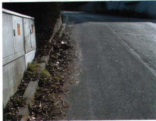
Extreme Verschmutzungen jeglicher Art, insbesondere im Rinnstein