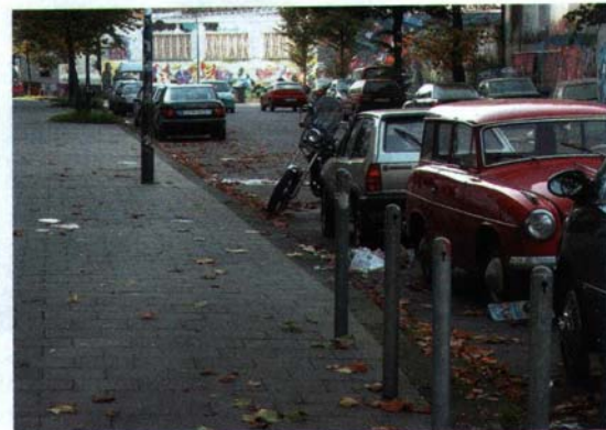
Flächendeckend starke Verunreinigungen durch Abfälle und Laub jeglicher Art auf der Fahrbahn und im Rinnstein

Fahrbahnen stellen die am stärksten frequentierten Verkehrswege dar (Individual-, Wirtschaftsverkehr, ÖPNV), wodurch es zu den unterschiedlichsten Verunreinigungen kommt. Aufgrund dessen wurde dieser Bereich als graphisches Beispiel ausgewählt. Analog hierzu gibt es zudem definierte Sauberkeitsstufen für Gehwege sowie Papierkörbe.