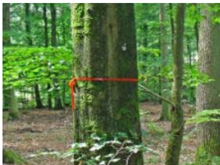
Partnerbaum im FriedWald

Partnerbäume sind ein Angebot für zwei Menschen, die sich nahestehen, für Ehepartner, Lebenspartner, Geschwister oder Freunde. Der Preis für einen Partnerbaum beginnt bei 2.700 Euro. Darin inbegriffen sind zwei Plätze. Bis zu acht weitere Plätze können sofort oder im Nachhinein für derzeit 500 Euro pro Platz erworben werden. Freie Partnerbäume im FriedWald sind durch ein rotes Band gekennzeichnet.