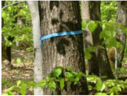
Familien- oder Freundschaftsbaum im FriedWald

Der Familien- oder Freundschaftsbaum kann einer ganzen Familie, einem Freundeskreis mit bis zu zehn Personen oder aber auch einer Einzelperson als Ruhestätte dienen. Noch freie Familien- und Freundschaftsbäume sind im FriedWald mit einem blauen Band gekennzeichnet. Mit dem Kauf eines Familien- oder Freundschaftsbaumes erwerben Sie eine Ruhestätte mit insgesamt zehn Plätzen für die Dauer von bis zu 99 Jahren (ab Eröffnung eines Waldes). Es müssen nicht alle zehn Plätze belegt werden.