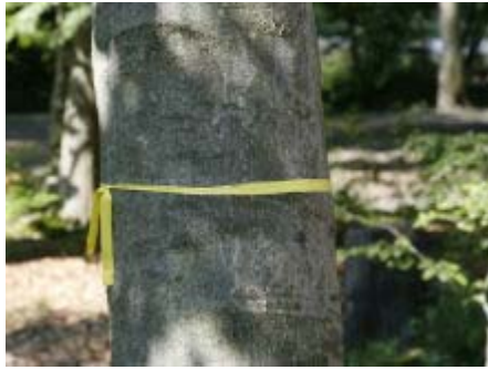
Gemeinschaftsbaum im FriedWald

Gemeinschaftsbäume dienen bis zu zehn Menschen als Begräbnisstätte. Anders als bei den Familien- oder Freundschaftsbäumen erwerben Sie hier lediglich einen oder mehrere Einzelplätze, unabhängig von familiären oder freundschaftlichen Beziehungen. Die Ruhezeit am Gemeinschaftsbaum beträgt bis zu 99 Jahre (ab Eröffnung eines Waldes). Gemeinschaftsbäume mit freien Plätzen sind mit einem gelben Band gekennzeichnet.