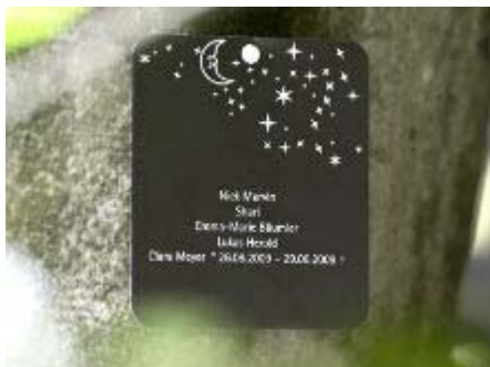
Sternschnuppenbaum im FriedWald

Der Sternschnuppenbaum ist eine kostenlose Ruhestätte, an der Kinder bis zum dritten Lebensjahr beigesetzt werden können.